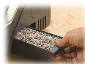
Bandeja de residuos lateral